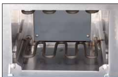
清掃性に優れた庫内