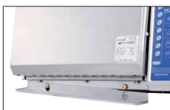
カス受けは取り外し可能

庫内の棚網とカス受け皿、扉下部のカス受けは簡単に取り外して洗えるため清掃性に優れています。またこれらの部品を外すことで庫内の清掃もしやすくなります。