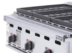
ヒートプロテクター