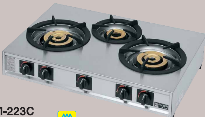
M-223C 税抜標準価格 110,000円