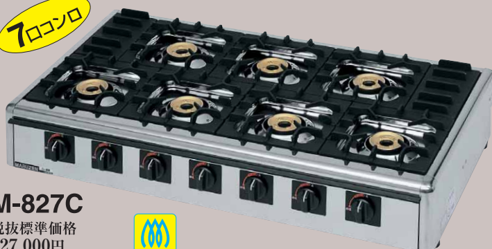
M-827C 税抜標準価格 127,000円