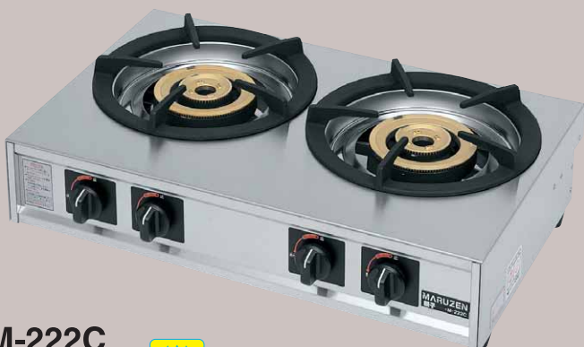
M-222C 税抜標準価格 75,000円