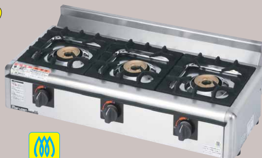
M-823E 税抜標準価格 61,000円