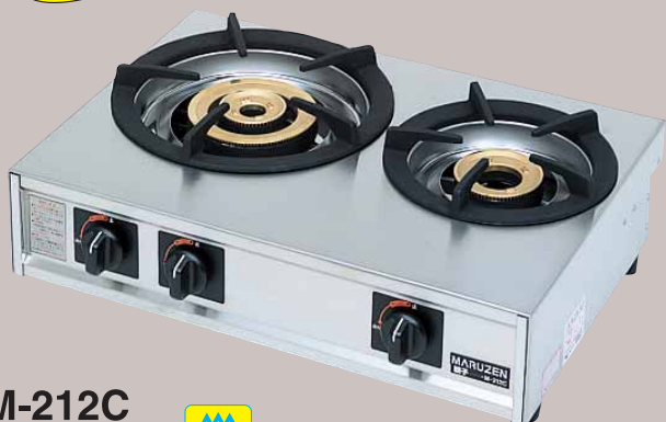
M-212C 税抜標準価格 65,000円