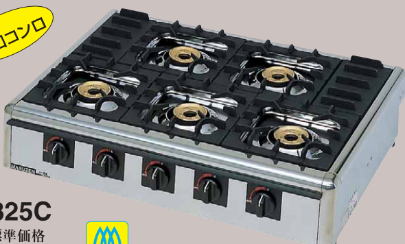
M-825C 税抜標準価格 116,000円