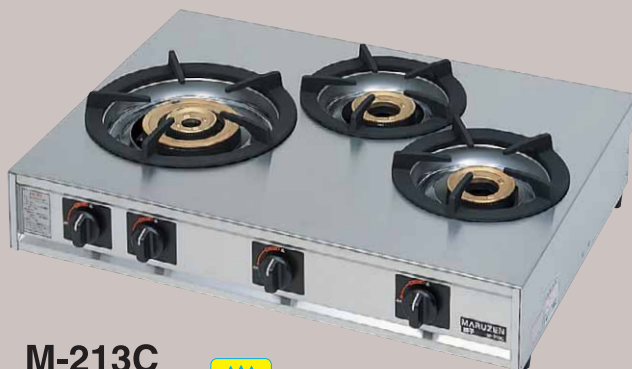
M-213C 税抜標準価格 99,000円